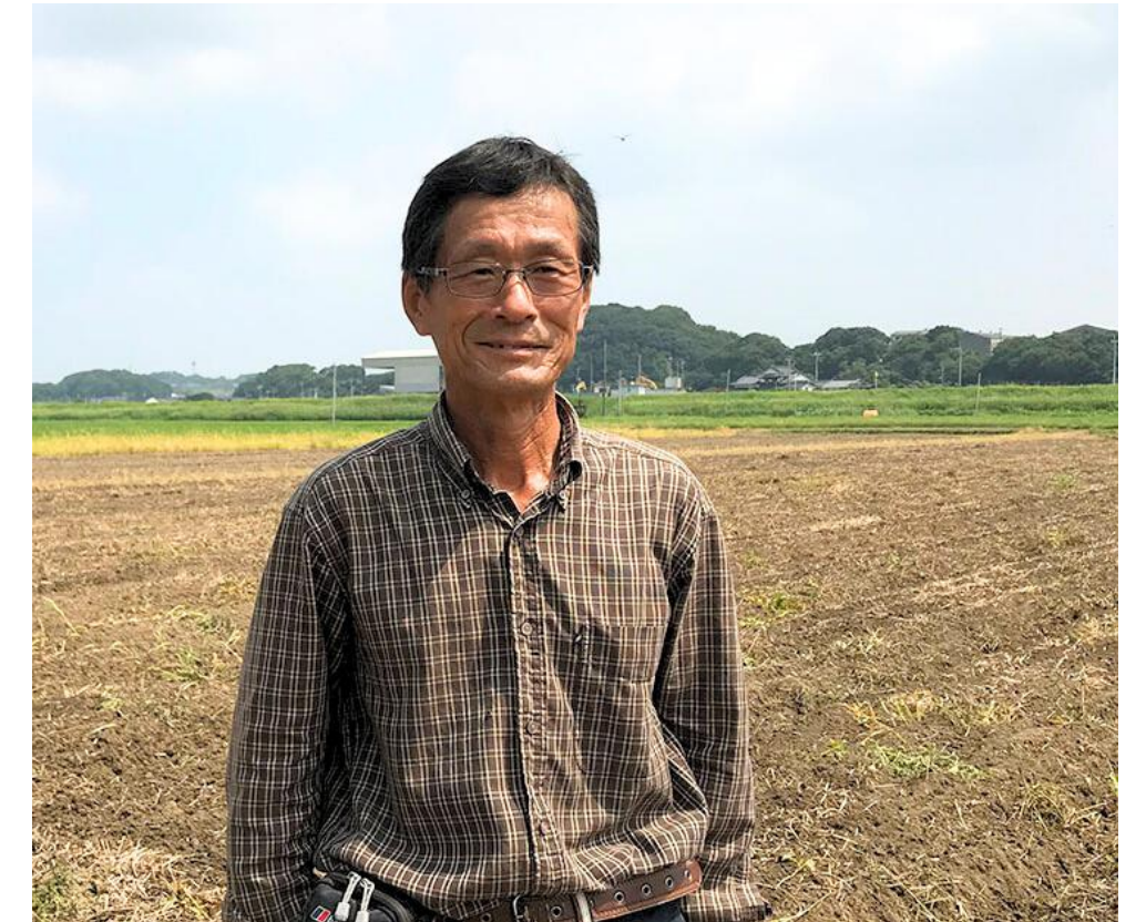
生産者の顔が見える 嘉麻ひすい大豆